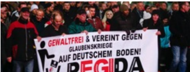
Die Vereinigung „Pegida“ steht für „Patriotische Europäer gegen die Islamisierung des Abendlandes“. An der 9. Demonstration haben 15.000 Menschen teilgenommen. Die Facebook-Seite von Pegida hat inzwischen 60.000 Anhänger.

Vechta. Der Kreisjugenddienst gönnte sich in seiner letzten Teamsitzung des Jahres ein bisschen Zeit und diskutierte über ein Thema, das derzeit in den Medien hochgespuscht wird: Fremdenfeindlichkeit. Die zunehmende Thematisierung in den Medien von Anschlägen durch radikale Islamisten, wird von rechtsorientierten Gruppen genutzt, um Demonstrationen gegen die Terrorgruppe „Islamischer Staat“ zu füllen. Dabei instrumentalisieren rechte Gruppen die Teilnehmenden der Demonstrationen für ihre rechtspopulistischen Inhalte. Auch Kanzlerin Merkel warnte in einem Interview vor der Instrumentalisierung bei den Demonstrationen. Kritisch gilt es außerdem zu reflektieren, wie die Medien die Themen behandeln. Die geschürte Angst wird scheinbar von rechten Gruppierungen gerne genutzt. Wäre sicherlich ein lohnenswertes Thema für die Jugendarbeit. js